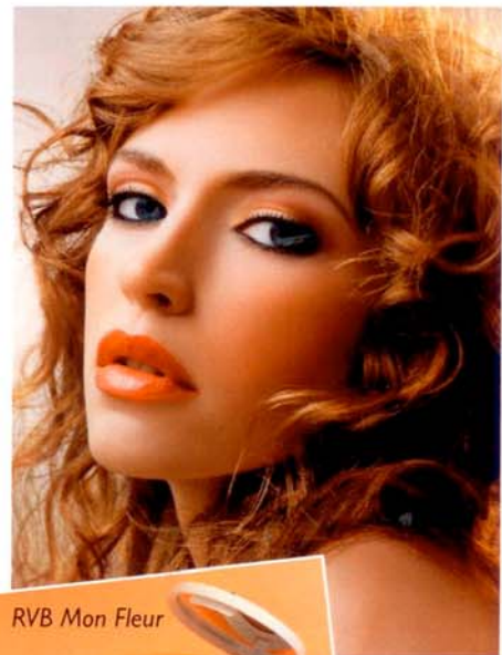
RVB Mon Fleur