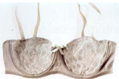
HIENOSTUNEET Wolfordin kaariliivit 139 € ja stringit 85 €.