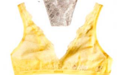
PITSISET Calvin Kleinin toppiliivit 39 € ja hipsterit 38 €.