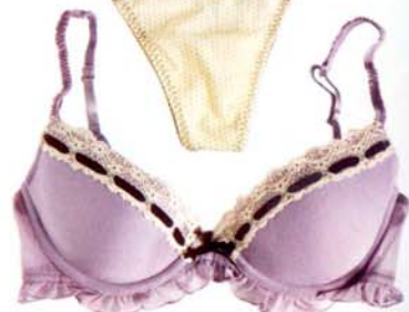
VIOLETIT topatut kaariliivit 12,90 € ja stringit 6,90 €, H&M.