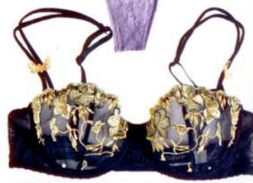
KIRJAILLUT Aubaden liivit 69,90 € ja hipsterit 79,90 €, Funky Lady.