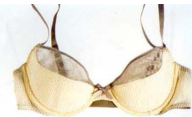
PILKULLISET Wolfordin kaarituelliset liivit 139 € ja stringit 65 €.