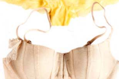
EDESTÄ kiinnitettävät liivit 22,95 € ja stringit 9,95 €, Lindex.