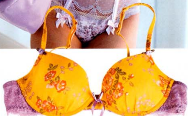
KELTAISISSA Parahin liiveissä on pitsinen sivuosa, 57 €. Rusettihpsterit 36 €.